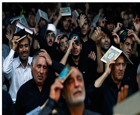
برگزاری مراسم شب قدر در مسجد جامع: در این مراسم تمام فضای مسجد پر از جمعیت می‌شود.

امام جماعت این مسجد نیز به عهده حضرت آیت‌الله هاشمی تبریزی است. عموماً آیت‌الله هاشمی در اکثر مراسم نماز جماعت شرکت می‌کنند و در صورت غیاب ایشان برخی از شاگردان ارشد ایشان مسئول برگزاری نماز جماعت در این مسجد هستند.