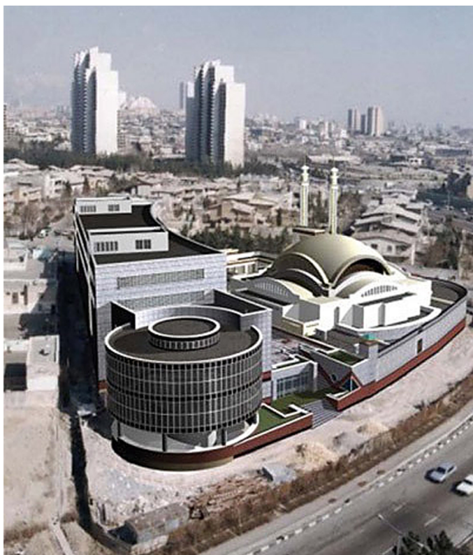
شکل (۱) موقعیت مسجد جامع در منطقه مدرن شهرک غرب