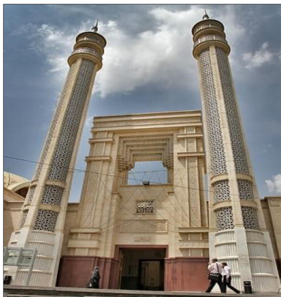
شکل (۳) بخش از طرح‌های روی سقف مسجد به همراه درب ورودی بسیار زیبای آن