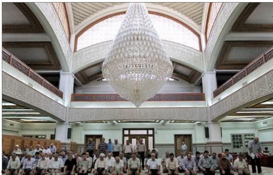
شکل (۴) هارمونی زیبای مسجد در این تصویر کاملاً قابل مشاهده است