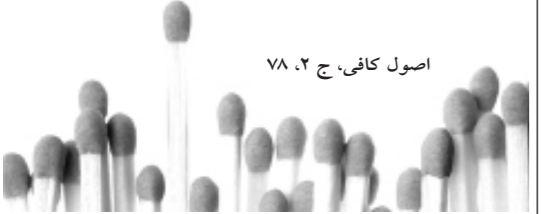
اصول کافی، ج ۲، ص ۷۸

امام صادق علیه السلام : از ما نیست و کرامتی ندارد آن که در شهری صد هزار نفری یا بیشتر زندگی کند و در آن شهر کسی باتقواتر از او باشد.