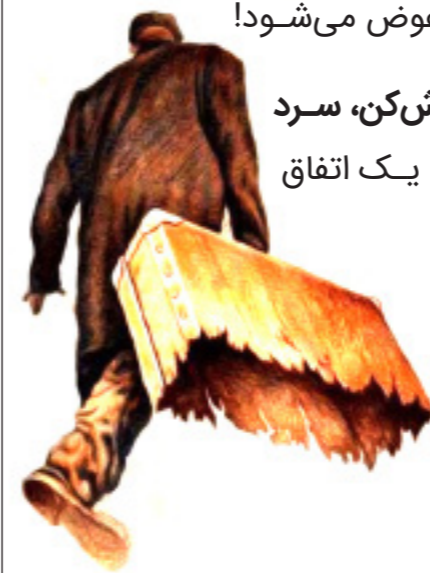
سوره مبارکه تکویر آیه ۱۴