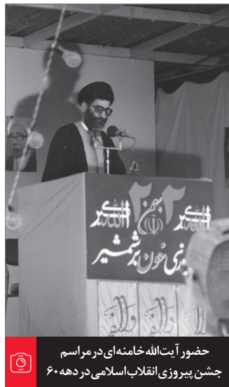
حضور آیت‌الله خامنه‌ای در مراسم جشن پیروزی انقلاب اسلامی در دهه ۶۰