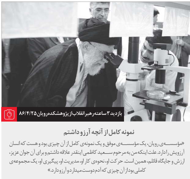
بازدید ۳ ساعته رهبر انقلاب از پژوهشکده رویان ۸۶/۴/۲۵

از دواجها را باید آسان گرفت آن وقت خدا هم بر ما همه چیز را آسان خواهد گرفت. ما به دنبال دختر و پسرهای مقید و متعبد و ولایتی هستیم که زندگیشان رووقف اسلام کنند... چرا در جامعه اسلامی سن ازدواج جوانهای مومن رفته بالا این یک خطر است بیاید دست در دست یکدیگر بگذاریم و برای این کار الهی قدمهای بزرگ برداریم. ●