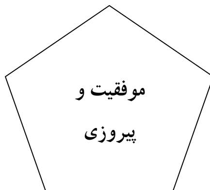
شکل شماره ۱- مدل مفهومی

طبیعی است که وزن مؤلفه‌های فوق در هر عملیات و در مناطق مختلف جبهه‌ها متفاوت بوده است. ولی در هر صورت نقش نیروی انسانی داوطلب و با روحیه و پراکنگیزه و دارای دانش و مهارت لازم در هر شرایطی مهم‌ترین نقش را در پیروزی‌ها ایفا کرده است و در زمانی هم که شکست روحی اتفاق افتاده است و استقامت رزمندگان فرو ریخته است کار چندانی از سایر مؤلفه‌ها بر نیامده است. با توجه به نکات فوق می‌توان مدل مفهومی زیر را برای درک بهتر موضوع ارائه داد. شاید تقدیم مدل زیر برای درک چگونگی نیل به پیروزی در عملیات‌ها بتواند به محققین کمک کند.