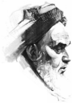
پردیس دانشکده های فنی دانشگاه تهران

حکومت، که شعبه ای از ولایت مطلقه رسول الله است، یکی از احکام اولیه اسلام است؛ و مقدم بر تمام احکام فرعی، حتی نماز و روزه و حج است... حکومت می تواند قراردادهای شرعی را که خود با مردم بسته است، در موقعی که آن قرارداد مخالف مصالح کشور و اسلام باشد، یکجانبه لغو کند. و می تواند هر امری را، چه عبادی و یا غیر عبادی است که جریان آن مخالف مصالح اسلام است، از آن مادامی که چنین است جلوگیری کند.