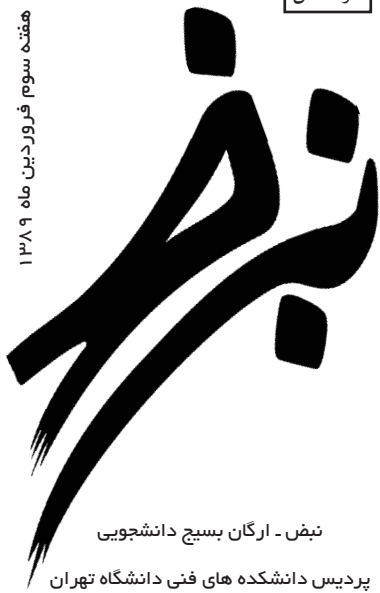
نبض - ارگان بسیج دانشجویی