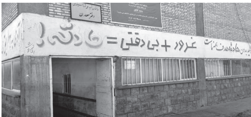
تصویر شماره ۳. دفتر معدن پابدانا (واقع در منطقه کوهناب کرمان)

ایدئولوژی سرزنش قربانی به مدیریت اقتدارگرایانه محیط کار مشروعیت می بخشد و تناقص بین خواست مدیران در جهت انباشت سرمایه از طریق تولید بیشتر و رابطه آن با وضعیت نامناسب ایمنی در محیط کار را پنهان می سازد. این امر از طریق تأکید بر تبیین های فردی حادثه به جای توجه به فشار حاصل از افزایش تولید و طراحی یک جانبه فرایند کار از سوی مدیران صورت می پذیرد.