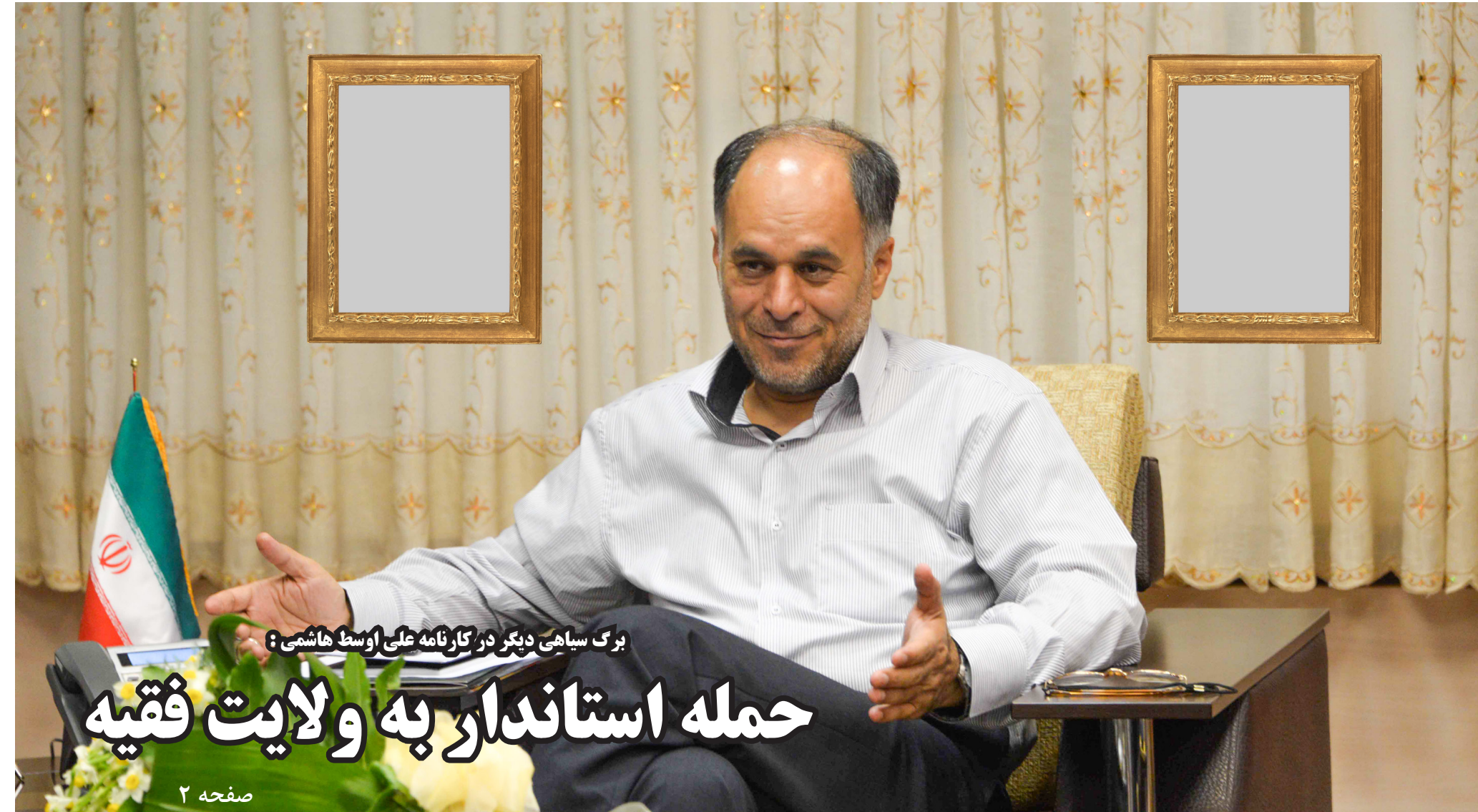
برگ سیاهی دیگر در کارنامه‌های علی‌اوسط هاشمی

دوشنبه ۱۲ بهمن ۱۳۹۴، سال دهم، شماره ۲۴۷ - قیمت: ۱۰۰۰ تومان - توزیع در استان‌های سیستان و بلوچستان، کرمان، هرمزگان و خراسان جنوبی