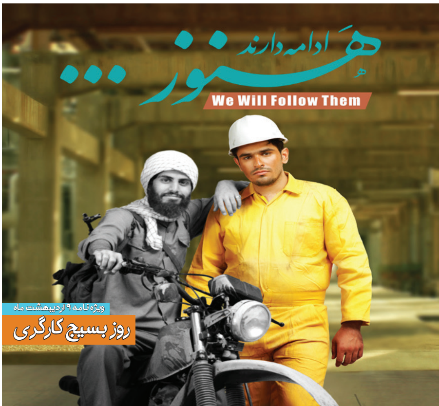
ویژه نامه ۹ اردیبهشت ماه

باسمه تعالی فرارسیدن روز جهانی کارگر فرصتی است تا همگان یک بار دیگر زحمات و تلاش های کارگران را در سراسر جهان به یاد آورند. در ایران اسلامی، علاوه بر جایگاه رفیع کار و کارگر، همگان سیره و اخلاق نبی مکرم اسلام(ص) این بنده برگزیده خداوند را سرلوحه خود قرار می دهند که با افتخار بر دستان پر تلاش کارگران بوسه زد و آنان را مورد تکریم قرار داد. کارگران عزیز و پرتلاش سایپا نیز به سان همستگران خود در تمامی عرصه های کار و تلاش، امروز می کوشند تا قدمی در راه کسب روزی حلال و حرکت پرافتخار کشور به سوی آینده بردارند. اینجانب ضمن قدرشناسی زحمات و مجاهدت های این عزیزان، فرارسیدن روز کارگر را به تمامی همکاران عزیزم به ویژه کارگران پرتلاش شاغل در خطوط تولید که انصافاً سرمایه های واقعی سازمان هستند تبریک عرض کرده و برای همه آنان آرزوی توفیق و سربلندی دارم.