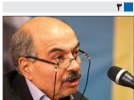
مدیرعامل سازمان قطارشهری اصفهان، هیچ اصراری نداریم خط دو مترو از میدان امام(ره) عبور کند