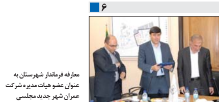
معارفه فرماندار شهرستان به عنوان عضو هیات مدیره شرکت عمران شهر جدید مجلسی