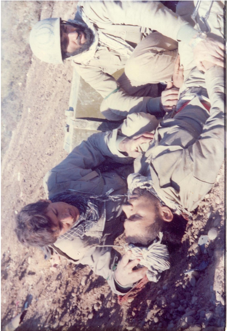
لحظات شهادت سردار شهید ناصر قاسمی در جبهه بُستان