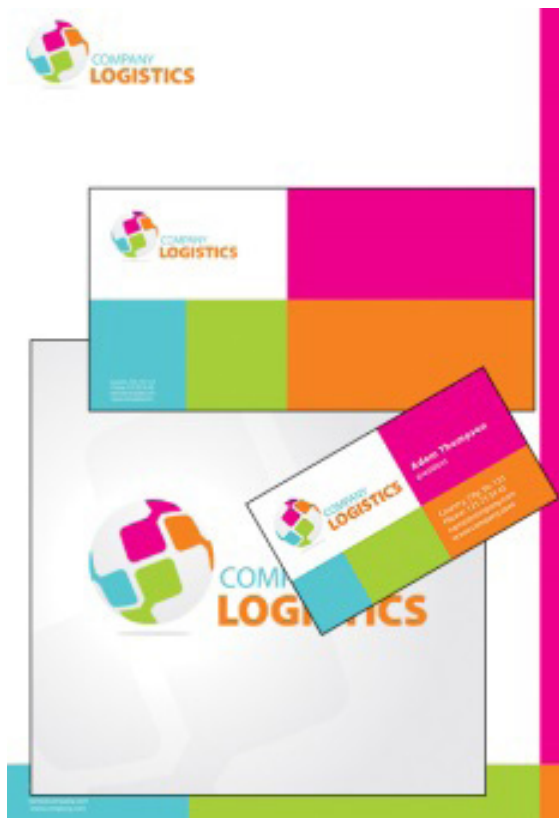
تصویر ۲. تصویر هویت سازمانی یک شرکت که ترکیبی از نشانه و رنگ با هم بازنمایی می‌شود. هدف: هویت‌نمایی و معرفی.

طراحی شده‌ای عین به عین کپی (یا نسخه‌برداری مانند آنچه در پیشینه در تعریف بازنمایی گفته شد) یا بازنمایی می‌شود. این بخش از بازنمایی مشابه آن چیزی است که «استوارت هال» (۱۳۷۶) آن را کلیشه‌سازی دانسته است و اشاره کرد