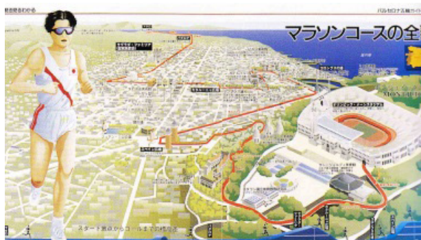
تصویر ۳. بازنمایی مسیر مسابقه دو مکان نهایی آن جهت راهنمایی عوامل برگزار کننده. هدف: اطلاع رسانی.

برخی بازنمایی‌ها در گرافیک عملکردی چندگانه مانند، هویت‌نمایی، اطلاع‌رسانی تبلیغاتی و تزئین دارند. روی جلد کتب، بروشورها یا بسته‌بندی یک محصول چنین عملکردی دارند