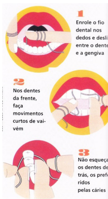
تصویر ۵. بازنمایی ساده و گرافیکی چگونگی استفاده از نخ دندان. هدف آموزش.

گونه‌ای دیگر بازنمایی در گرافیک اطلاع رسانی، بازنمایی با تلخیص یا ساده‌سازی است؛ مانند اصلاح گرافیکی تصویر یک نقشه و کاربردی کردن آن به جهت تشخیص بهتر مسیرها (تصویر ۵). بازنمایی تصویر گفته شده با بازآفرینی توأم است. در پیشینه به نقل از «پهلوان» گفته شد که در آثار گرافیک با دو جنبه خلاقیت و ارتباط مواجه هستیم، به نظر می‌رسد در این اثر دو ویژگی گفته شده نمایان است.