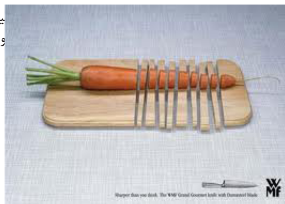
تصویر ۶. تبلیغ یک کارت آشپزخانه که باز بازنمایی تصویری و اغراق در برش چوب زبردست قدرت برش کارت را نشان می دهد. هدف: عرضه و تبلیغات ارتباط سریع. مأخذ : www.themost10.com

کارکردی چندگانه داشته باشد. برای مثال یک اثر بازنمایی ضمن اینکه اطلاع رسان است ممکن است هویت نما و تبلیغاتی هم باشد؛ بنابر برخی از دستاوردهای این مقاله که به گمان در قیاس با پیشینه فراتر از آن است بدین شرح بیان می شود : بعضی از بازنمایی‌ها فاقد مابه‌ازاء خارجی هستند، مانند نشانه‌ای که از یک شکل انتزاعی طراحی می شود. همه بازنمایی در گرافیک معطوف به گذشته نیست، گاه آثار گرافیک بازنمایی آینده هستند (مانند تصاویر فناوری‌های نوین) بازنمایی‌هایی خلاقانه در راستای ذات گرافیک را می توان بازآفرینی نامید. برخی از شاخه‌های گرافیک چون نشانه به علت ضابطه مند بودن قابل تغییر و دخل و تصرف نیستند بنابراین بازنمایی در این گونه موارد نعل به نعل است. مانند نشانه‌های سازمان‌ها شرکت‌ها و نشانه‌ها و علائم رسمی دولت‌ها. نمودار ۱ چگونگی بهره‌گیری از مطالب پیشینه بحث و دستاوردها را نشان می دهد.