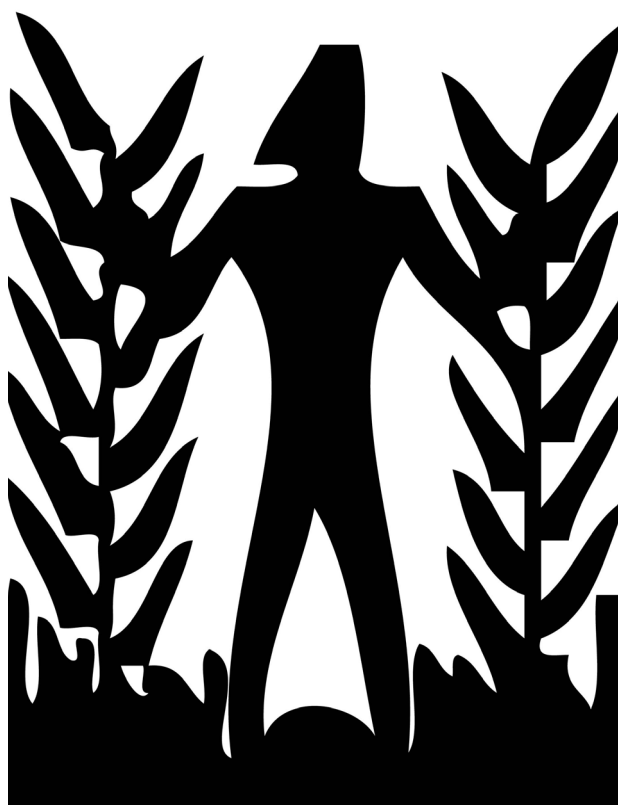
تصویر ۱. این نشانه با موضوع کار سازمانی که برای آن طراحی شده و محل استقرار آن (منطقه خوزستان) هماهنگ است.