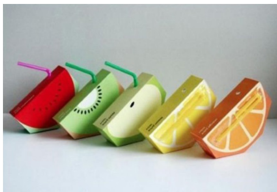
تصویر ۷. بسته بندی محصول هدف نشان دادن درون محصول . هدف: معرفی محصول، تبلیغات با ارایه بسته‌ای جدید و اطلاع رسانی محتوی درون محصول