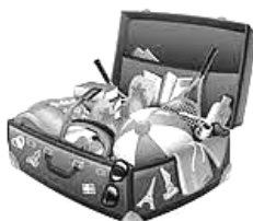
pack for a trip