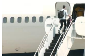
board the plane