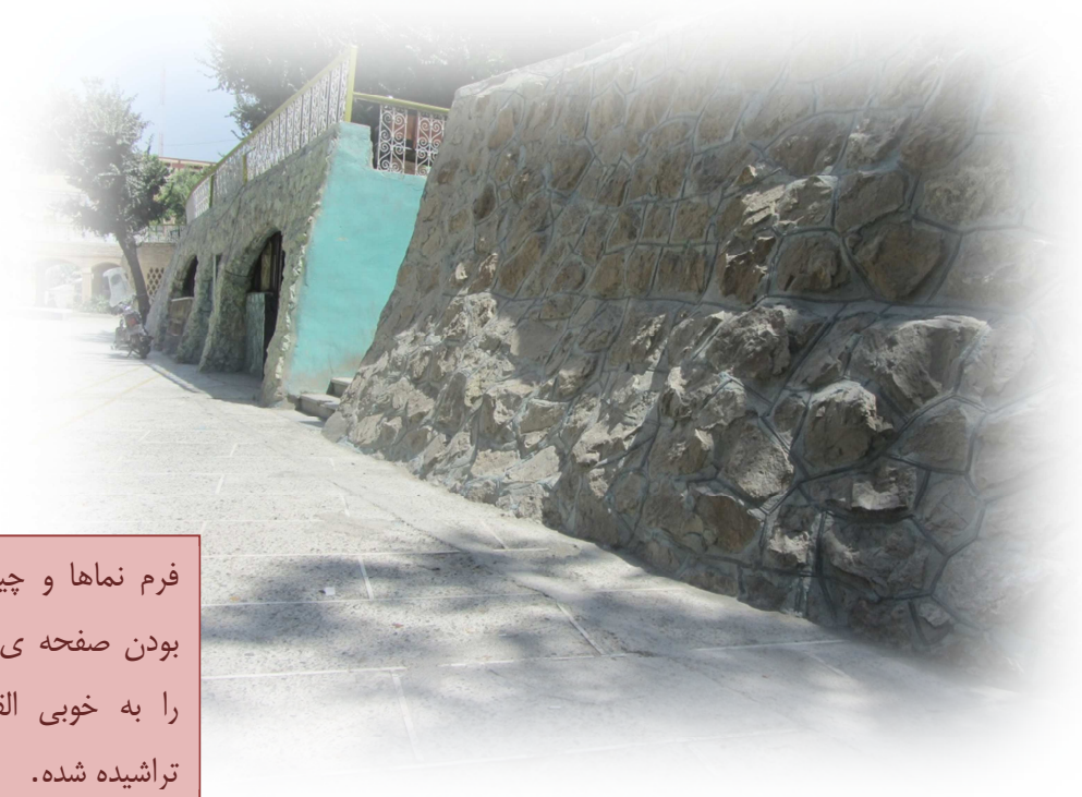
فرم نماها و چیدمان سنگها بویژه شیبدار بودن صفحه ی نمای ساختمان این حس را به خوبی القا میکند که بنا در کوه تراشیده شده.