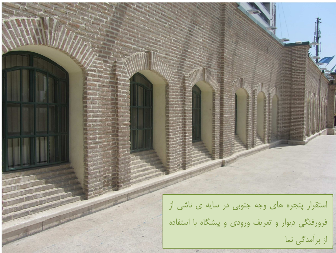
استقرار پنجره های وجه جنوبی در سایه ی ناشی از فرورفتگی دیوار و تعریف ورودی و پیشگاه با استفاده از برآمدگی نما