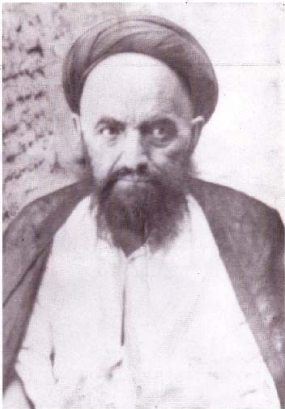
تمثال حضرت آية الله العظمى حاج سيد ميرزا علي قاضي، در سن قريب ۸۰ سالگی