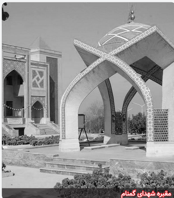
مقبره شهدای گمنام