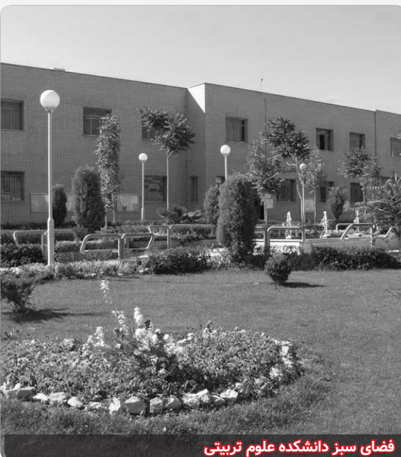
فضای سبز دانشکده علوم تربیتی