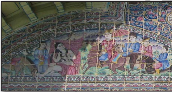
تصویر ۱. هلالی سمت راست، دیدن خسرو شیرین را در چشمه‌سار. عکس: سحر اتحادمحکم، ۱۳۹۰.

از بناهای ماندگار دوره قاجاریه به عنوان سلسله قدرت ساخته است ...". در کاشی نگاره‌های خورشیدی ضلع شرقی کوشک اصلی باغ، مجالسی به نام‌های "مدهوش شدن ندیمگان از جمال یوسف"، "دیدن خسرو شیرین را در چشمه‌سار"، "رستم در بارگاه حضرت سلیمان (ع)" تصویر شده است که هر مجلس داستانی را با مضمون خاص اما در نهان مشترک خود روایت می‌کند. این تصاویر در عین اختلاف، حکایت‌گر و نشأت گرفته از یک مضمون مشترک هستند و آن مضمون مشترک مغلوب و منفعل شدن یک سوی رابطه (ندیم، خسرو، رستم) در برابر سوی دیگر رابطه (یوسف، شیرین، سلیمان) است. در اینجا است که نظر فوکو درباره تأثیر قدرت در شبکه اجتماعی و ارتباطات انسانی و معنا و تفسیر و گفتمانی که از آن می‌جوشد، به کارمان می‌آید. قدرت زیبایی یوسف و قدرت تحریک جنسی شیرین و قدرت معنوی و ایزدی و خداداد سلیمان سوی دیگر رابطه‌ها را گرفتار می‌کند و بقول فوکو هم قدرت بطن این ارتباط است، هم میان فردی قرار دارد و هم دو سوی مجزای ارتباط و حفظ‌کننده آن هستند. یکی از بخش‌های منظومه تغزلی خسرو و شیرین، صحنه اولین دیدار خسرو و شیرین در چشمه‌سار است؛ لحظه‌ای که خسرو، شیرین را در حال آبتنی در چشمه می‌بیند. مصورسازی این قسمت از داستان در هلالی سمت راست سردر ورودی عمارت باغ مجاور دو مجلس مذکور دیده می‌شود (تصویر ۱). مجلس دیگری که در هلالی سمت چپ کاشیکاری عمارت (تصویر ۲) دیده می‌شود، صحنه مدهوش شدن ندیمگان از جمال حضرت یوسف (ع) است.