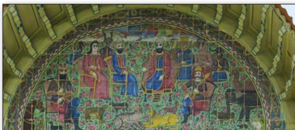
تصویر ۳. هلالی فوقانی، رستم در بارگاه حضرت سلیمان، عکس: سحر اتحادمحمک، ۱۳۹۰.