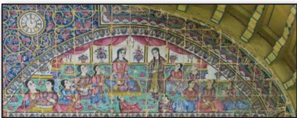
تصویر ۲. هلالی سمت چپ، مدهوش شدن ندیمگان از جمال حضرت یوسف (ع). عکس: سحر اتحادمحکم، ۱۳۹۰.