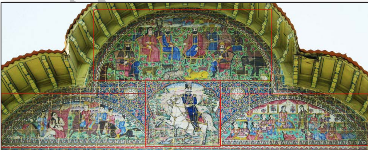
تصویر ۴. سه هلالی سردر ورودی عمارت باغ ارم، عکس: سحر اتحادمحکم، ۱۳۹۰.