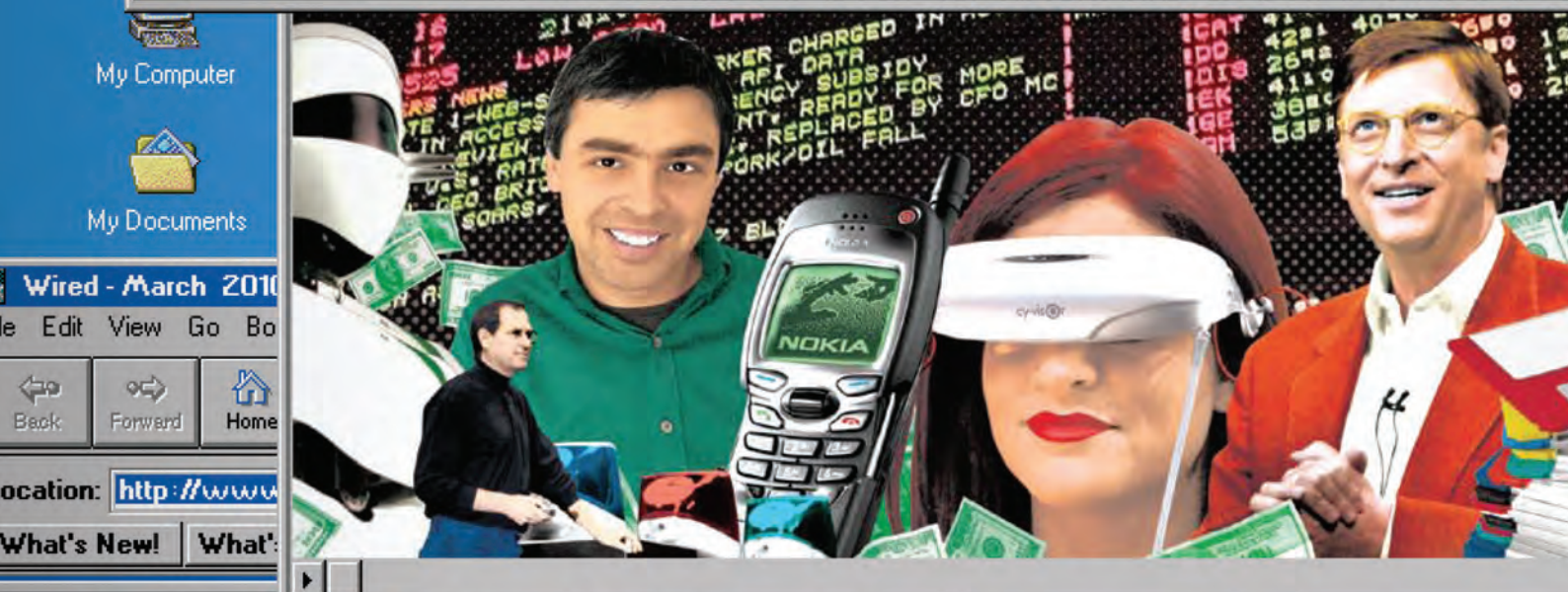
Illustration by Gluekit

در تاریخ دهم مارس سال ۲۰۰۰ میلادی، NASDAQ به شاخص ۵۰۴۸/۶۲ رسید اما پس از آن به شدت سقوط کرد و دیگر هرگز به آن سطح بازنگشت. در ادامه نگاهی داریم به دوران آغاز فعالیت آن زمانی که میلیون‌ها آرزو بر باد رفت.