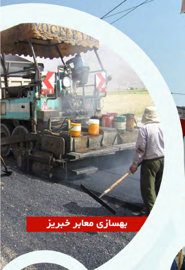
بهسازی معابر خبریز