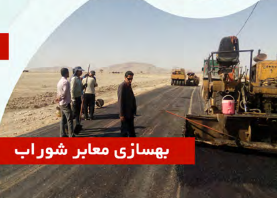
بهسازی معابر شوراب