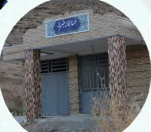
افتتاح غسالخانه خبریز