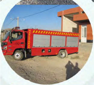
راه اندازی آتشنشانی شوراب