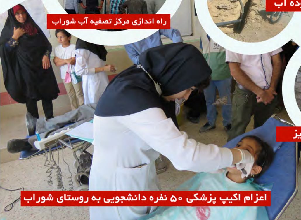
اعزام اکیپ پزشکی ۵ نفره دانشجویی به روستای شوراب