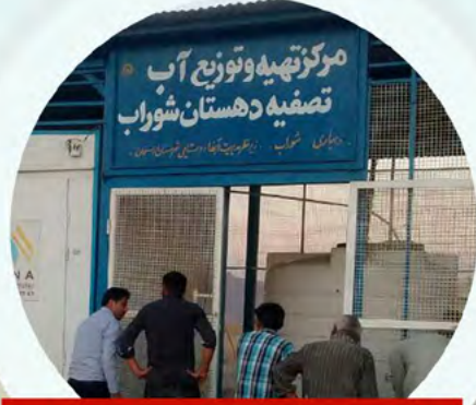
راه اندازی مرکز تصفیه آب شوراب