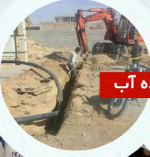
تعویض شبکه فرسوده آب