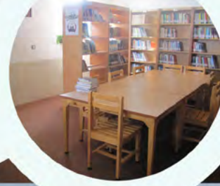
راه اندازی کتابخانه روستای جمال آباد