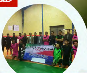
برگزاری مسابقات ورزشی