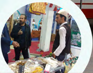
حضور در نمایشگاه تهران