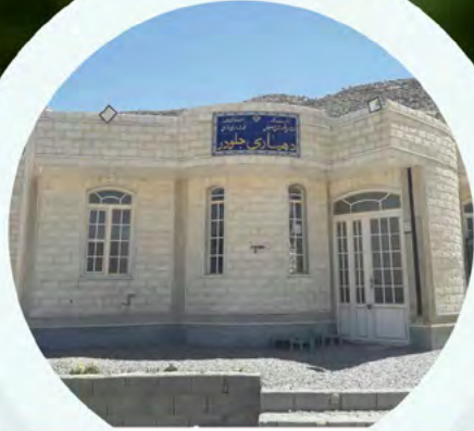
احداث ساختمان دهیاری جلودر