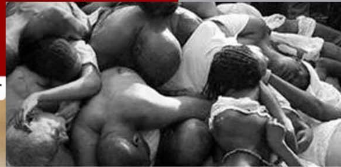
سودای پادشاهی پسر ملک سلمان فاجعه آفرید