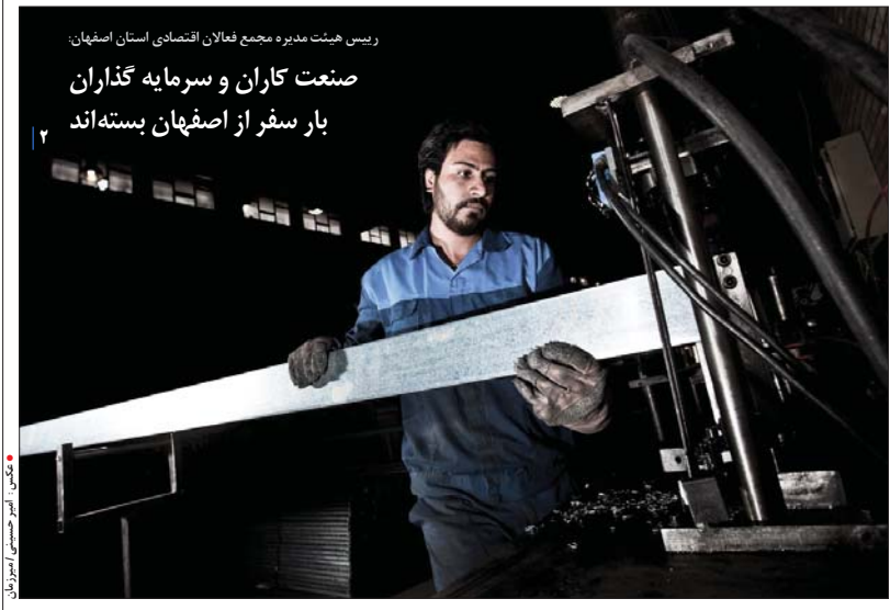
رئیس هیئت مدیره مجمع فعالان اقتصادی استان اصفهان: صنعت کاران و سرمایه گذاران بار سفر از اصفهان بسته اند