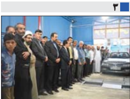
سی و هفتمین مرکز معاینه فنی خودرو سبک استان، در شهر کرماند افتتاح شد