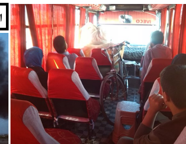
وقتی مسافر نیست دوچرخه هست! جاده کاشان