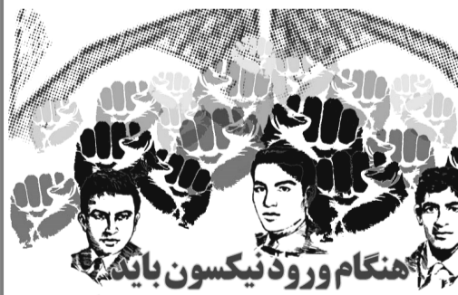
صدای دانشجویان خفه گردد