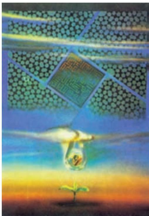
طراح ابوالفضل عالی

صبح، دو مرغ رها بی صدا صحن دو چشمان تو را ترک کرد شب، دو صف از یاکریم بال به بال نسیم از لب دیوار دلت پرکشید ۲ آفتاب، خار و خس مزرعه‌ی چشم تو آبشار، موج فروخته‌ای از خشم تو می‌شود از باغ نگاهت، هنوز یک سبد از میوه‌ی خورشید،