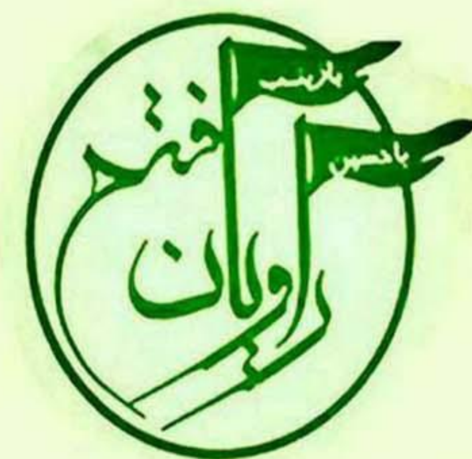
گروه راویان فتح سپاه سیدالشهدا (ع)

فرزند شهید همت در واکنش به توهین های اشراقی: ایشان نمی فهمد با چنان مطلبی تا چه حد وحشتناکی، بنیانگذار جمهوری اسلامی را زیر سؤال برده و خوار و کوچک کرده؟