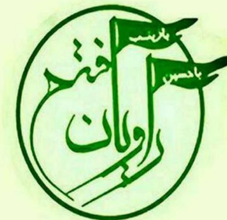
گروه راویان فتح سپاه سیدالشهدا (ع)