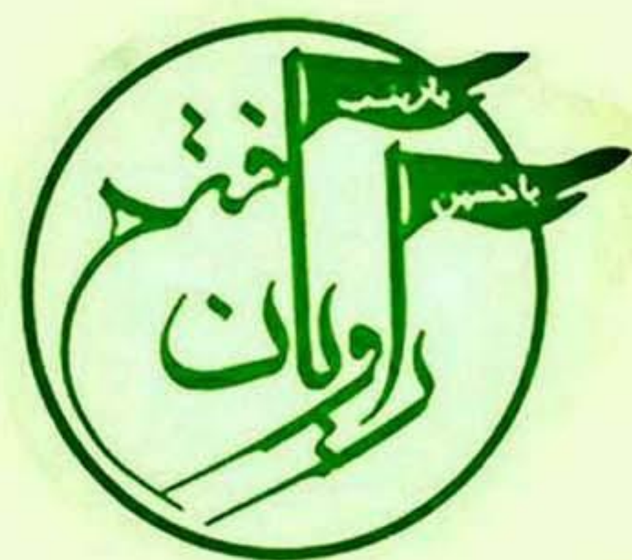
کروه راویان فتح سپاه سیدالشهدا (ع)

امام خمینی(ره): ضرر آنها (نهضت آزادی)، به اعتبار آنکه متظاهر به اسلام هستند و با این حربه جوانان عزیز ما را منحرف خواهند کرد و نیز با دخالت بی مورد در تفسیر قرآن کریم و احادیث شریفه و تأویلهای جاهلانه موجب فساد عظیم ممکن است بشوند، از ضرر گروهکهای دیگر، حتی منافقین این فرزندان عزیز مهندس بازرگان، بیشتر و بالاتر است.