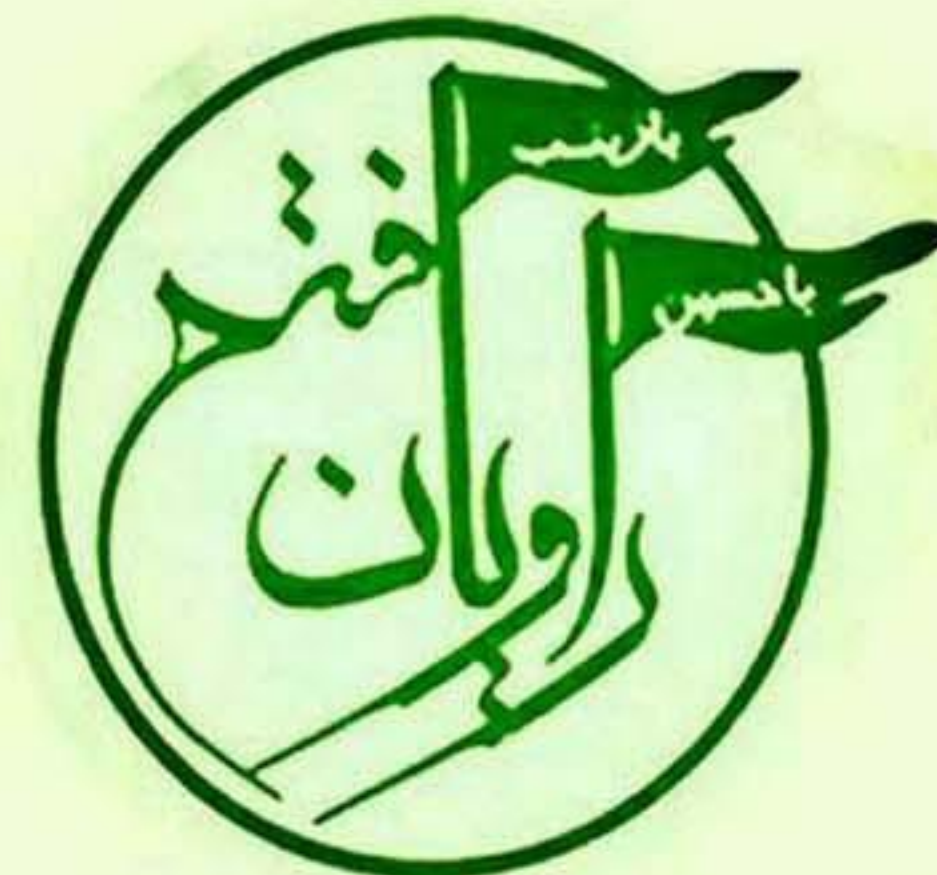
گروه راویان فتح سپاه سیدالشهدا (ع)

به جز رعایت حریم رهبر معظم انقلاب اسلامی که وظیفه همه است، مسئولیت‌ها هر اندازه بزرگتر باشد مردم باید نسبت به طرح نقطه نظرات و انتقادات خود درباره آنها حساس‌تر باشند! یکی از گرفتاری‌هایی که متأسفانه بعضی‌ها به آن دچار شده‌اند این است که نمی‌توانند نظرات مخالف خود را تحمل کنند. این شیوه عمل منجر به دیکتاتوری می‌شود و با فرهنگ انقلاب و اصول بنیادین نظام اسلام ما مغایرت دارد