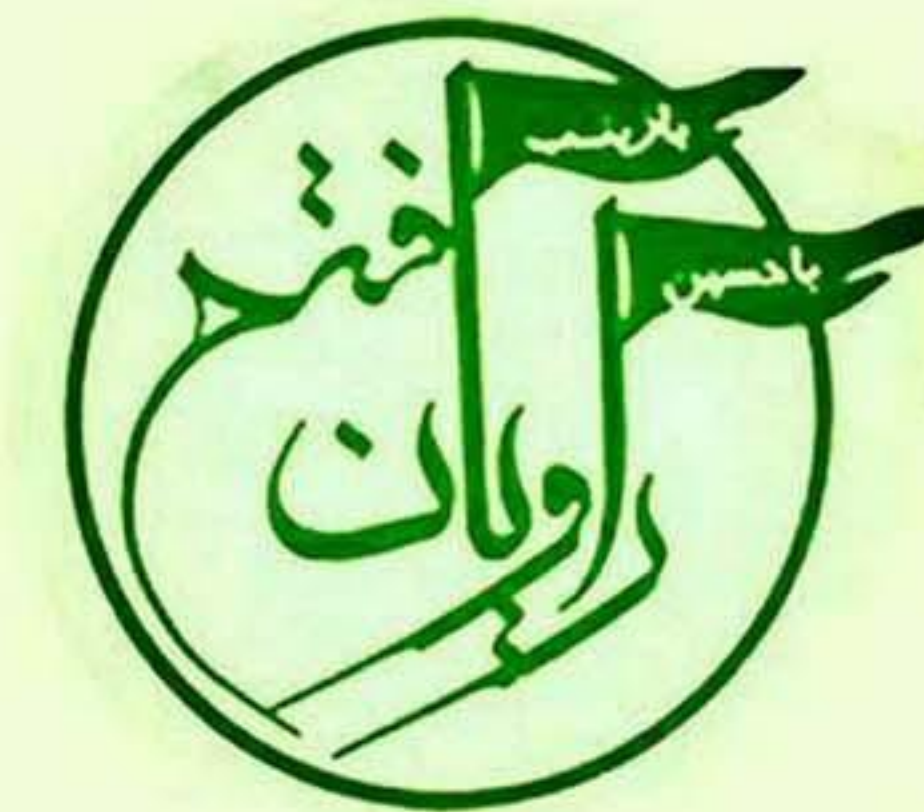
گروه راهیان فتح سپاه سیدالشهدا (ع)

آیت الله موسوی بجنوردی به واسطه رابطه فامیلی که با سید حسن خمینی دارد، از افراد اثرگذار در بیت امام خمینی است. موسوی بجنوردی ذی نفوذترین فرد در پژوهشکده امام خمینی به حساب می آید. با بررسی پایان نامه های این پژوهشکده، مشاهده می شود که موسوی بجنوردی در اکثر پایان نامه ها نقش دارد.