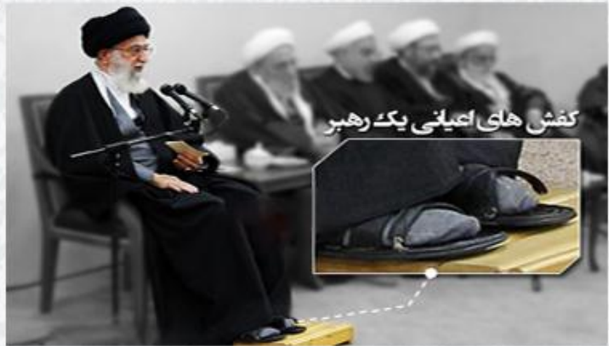
کفش های اعیانی یک رهبر

در عجبم از رهبری که می گویند ۹۵ میلیارد دلار دارایی دارد، کلکسیون های رنگ و وارنگ از هر نوع دارد، ۱۷۰ عصای آنتیک دسته طلا دارد، بجای نان و پنیر در صبحانه اش خاویار رشت دارد، بجای بیت چندین و چند ویلا در شمال دارد، عباهایی به قیمت ۴۰۰ هزار دلار دارد، هواپیمای ۳۳۰ برای جابجایی اسب هایش دارد، باغ ملک آباد به مساحت ۱۰ هزار متر در مشهد دارد، کمسیون ۵ سستی از یک میلیون و نهصد هزار بشکه نفت دارد، پس نمی دانم این چه کفش های پینه بسته ایست که او به پا دارد؟؟؟؟!!!!