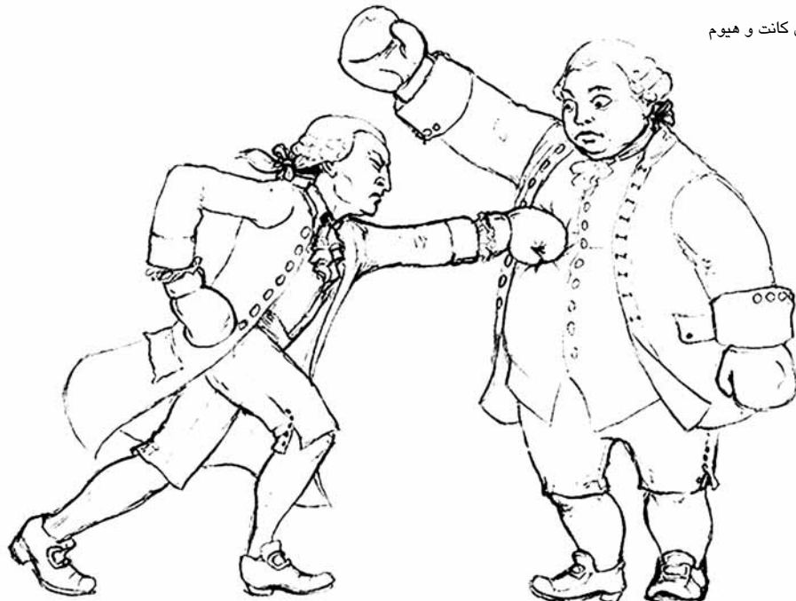
جدل کانت و هیوم

بدین ترتیب، راست‌گویی حتی در برابر قاتلان، فرمانی مطلق است و هیچ مصلحتی آن را محدود نمی‌سازد و