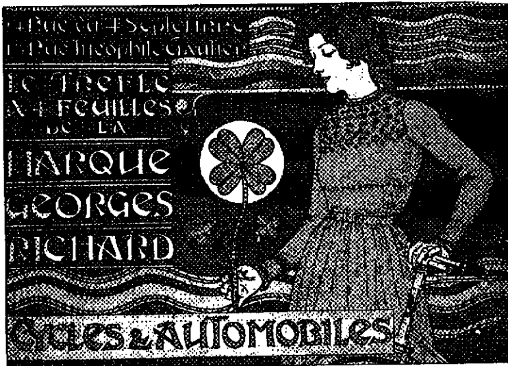
یوجین گراسه - پوستر موتور و اتومبیل - ۱۸۹۹