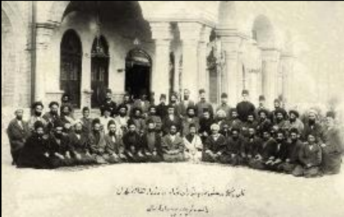
تصویر گروهی از دانشمندان و استادان در دوره قاجار دانشمندان و استادان در دوره قاجار