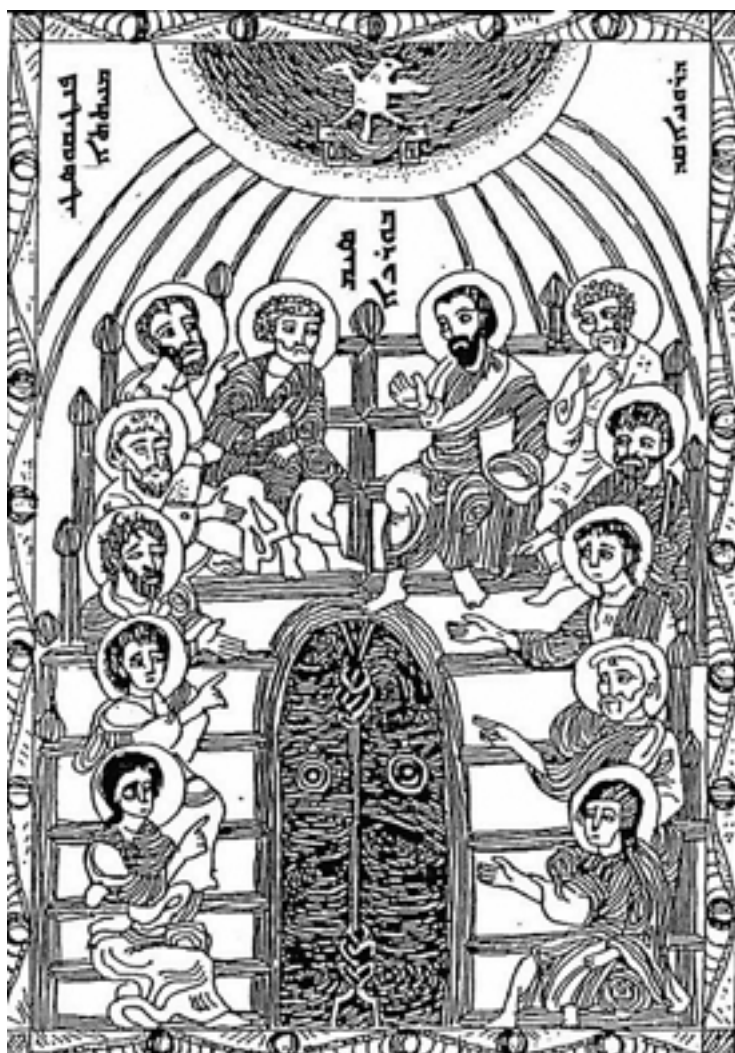
نزول روح القدس

در این شمایل که در سال ۱۲۲۲ توسط راهبی از کلیسای شرق نقاشی شده، شاگردان مسیح از جمله دوزن را می بینیم که در اتحاد با هم نشسته اند و دستشان به یک درب بسته اشاره می کند. ایشان چون روح القدس را یافته اند استغاثه می کنند که بر این درب بسته بیاید و آن را به روی دنیا باز کند. نشانه ای از مأمورین جهانی کلیسا.