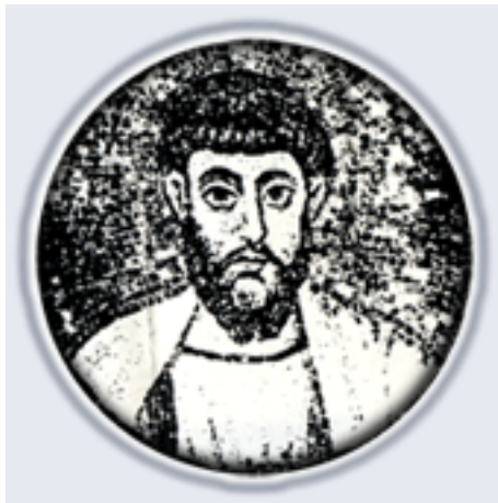
شمایل تومای رسول به صورت موزائیک، کلیسای بیژانتین، قرن پنجم، در شهر راون در ایتالیا. بر طبق روایات توما در امپراتوری فارس و امپراتوری هندوستان بشارت می‌داد.

در مورد تومای قدیس، رسول شرق، سنت کلیسا به ما می‌آموزد که او و عده زیادی از شاگردان که از جمله مارآدای و مارماری را می‌توان نام برد، به سوی ادسا و از آنجا به سوی امپراتوری فارس رفت و از همراهان خویش در آنجا جدا شد و ایشان در قرن اول کلیسا را مخصوصاً در سلوکیه تیسفون بنیان نهادند. کلیسای ایران خیلی آرام و تدریجی و در صلح و آرامش توسعه می‌یافت تا زمان روی کار آمدن سلطنت ساسانیان که مذهب زرتشت را مذهب دولتی اعلام کردند و شکنجه و آزار شدیدی بر مسیحیان وارد نمودند. این امر تا زمان استیلای اعراب و سقوط سلطنت ساسانیان ادامه یافت.