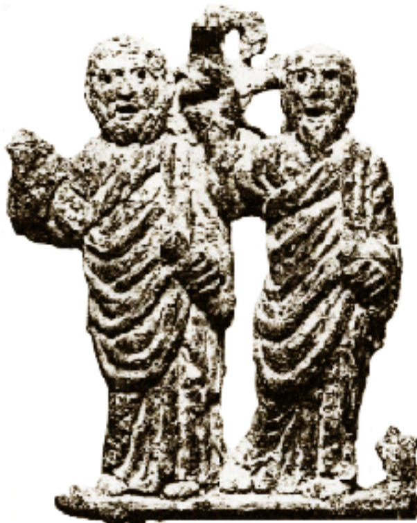
پولس و پطرس رسول. برنز. ایتالیا قرن ۴.

بعدها در نامه هایی که پولس یا شاگردانش نوشتند معنی این کلمه تحول یافت. در نامه های بعدی کلمه «کلیسا» به صورت مفرد به کار می رود و نشان دهنده جماعت مسیحیان است (۱۲ بار از مجموع ۱۶ باری که این واژه به کار رفته) و دیگر به معنی کلیسای محلی به کار نمی رود و مخصوصاً کلمه «بدن مسیح» به معنی کلیسا به عنوان یک واقعیت جهان شمول به کار رفته است. برای اثبات این مطلب می توان به این نکته اشاره کرد که بعد از این سر این بدن یعنی مسیح از اعضای آن که همان تعمید یافتگان هستند تمییز داده می شود (کول ۱:۱۸، افس ۱:۲۲-۲۳). برای مطالعه بیشتر در خصوص این مطلب به «گروههای مطالعاتی کتاب مقدس» صفحه ۴۹ رجوع کنید.