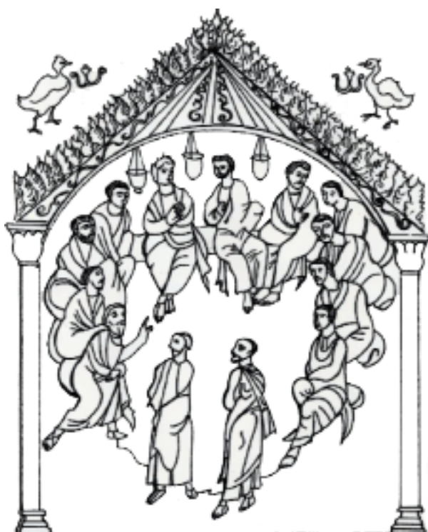
شمایل سریانی انتخاب متیاس

امروزه اکثر دانشمندان کتاب مقدس بر این باورند که سه رساله به تیموتاوس و تیتس که به «رسالات شبانی» معروفند به دوره بعد از رسولان، بنابراین حتی به دوره بعد از پولس رسول تعلق دارند. به همین دلیل است که تاریخ نگارش آنها را معمولاً اواخر قرن اول یا اوایل قرن دوم می‌پندارند. دلایل زیادی وجود دارند که مانع انتساب نگارش این رسالات به پولس رسول می‌شوند، از میان آنها می‌توان به ویژه به کاربرد کلمات خاص و همینطور اشتغال فکری مولف و موضوعات الهیاتی اشاره نمود که در رسالات پیش از آنها وجود ندارد. با این حال این رسالات هم متعلق به سنت پولس رسول به رسمیت شناخته شده‌اند و به همان اندازه نیز اثر لوقا بشمار می‌روند.