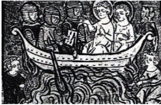
یوحنا رسول در سفر بشارتی. نقاشی متعلق به قرن ۱۴.

دعوت به زندگی در اتحاد تنها به اعضای کلیساهای محدود نمی شود بلکه روابط کلیساهای یوحنا با سایر کلیساهای نیز مد نظر است یعنی «کلیسای بزرگ که مظهر آن پطرس است. روایات مربوط به پطرس و «شاگرد محبوب» از جمله روایت ورود به قبر عیسی (۱:۲۰-۱۰) و همچنین آخرین صحنه این انجیل (۲۱:۲۰-۲۴) حاکی از این موضوع است. هر گروه تجربیات خود را بیان می کند و دعوت خاص خود را دارد ولی تجربیات و بیان سایر کلیساهای را رد نمی کند بلکه برعکس همگی نشانگر یک حقیقت واحد در مسیح قیام کرده هستند. این اجتماعات و روابطی که خواهان آن بودند به ما نشان می دهند که گشودن درها به سوی یکدیگر در حفظ حیات قدرتمند کلیسا اهمیت خاص دارد.