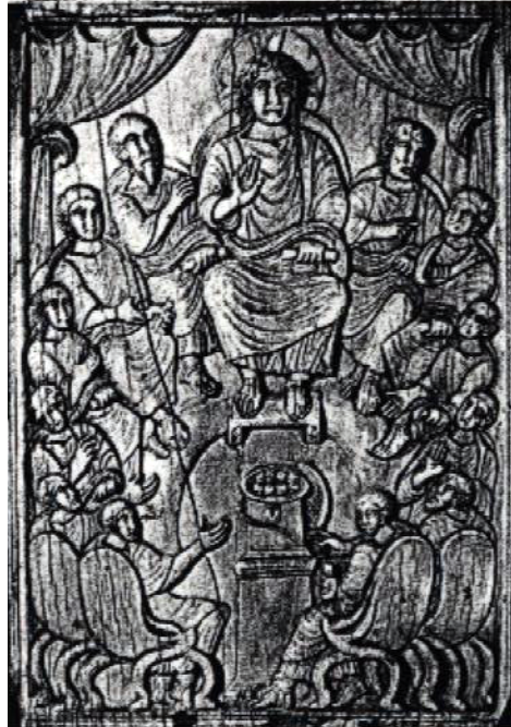
مسیح و رسولان.

بایستی از بکار بردن نام رسولان در طی زندگی عیسی خودداری نمود و نام زیبایی را که اناجیل به این شاگردان مقدم می دهند یعنی نام «دوازده» را محفوظ داشت. در واقع عیسی