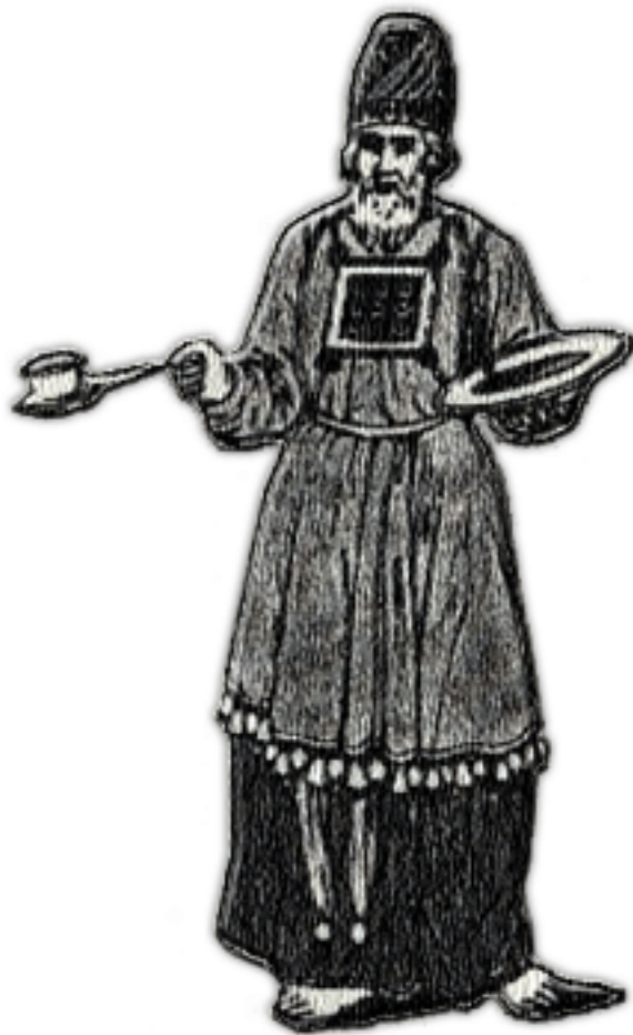
کامن اعظم یهود

اعلام شد و این امر بیانگر جفاهایی است که در قرن دوم و سوم بر کلیسا وارد می‌آمد. ولی با این احوال نیز کلیسا در اثبات وفاداری خود به امپراتوری می‌کوشید: از نویسندۀ اعمال رسولان که پولس را شهروندی نمونه معرفی می‌کند تا ژوستین شهید که آخرین رساله دفاعی خود را خطاب به امپراتور نوشت (حدود سال ۱۵۰) و بدین وسیله دربارهٔ دین مسیحی توضیحاتی می‌دهد تا اتهامات و زمزمه‌های بدخواهانه را پایان بخشد.