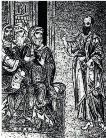
پولس رسول در حال تعلیم در کنیسه دمشق. موزاییک متعلق به قرن ۱۲ در موثریال

مسیحیت نخستین موفقیت‌های خود را در محیطهای مذهبی ای کسب کرد که با کاهنان و روحانیون معبد منازعات عمیق داشتند. در این مورد باید قبل از هر چیز به جلیل اشاره کنیم. عیسی «ناصری» و همین‌طور شاگردانش که هسته مرکزی جامعه مسیحیان اورشلیم را تشکیل می‌دادند جلیلی بودند. جلیل محل اختلاط نژادی و مذهبی بود و در آنجا راست‌دینی خشک یهودیه و روحانیون معبد چندان مورد پسند واقع نمی‌شد. از سوی دیگر ساکنین یهودیه اهالی جلیل را حقیر می‌شمردند. پرسش نتنائیل از فلیپس را به یاد آورید: «مگر می‌شود که از ناصره چیزی خوب بیرون آید؟»