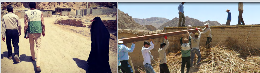
ترمیم و بازسازی خانه محروم