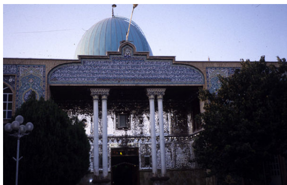
«پیغمبریه» در قزوین. محل دفن چهار پیغمبر یهودی است.

پس از پیروزی انقلاب در ایران در مجلس خبرگان قانون اساسی نیز نماینده کلیمیان ایران حضور فعال داشت. کلیمیان طبق قانون اساسی دارای یک نماینده در مجلس شورای اسلامی هستند.