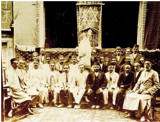
تصویری قدیمی از یهودیان در همدان

از دوره‌های کهن تاکنون یهودیها در هر جایی که بوده‌اند برای اداره امور فرهنگی، مذهبی و آموزش اصول دینی سازمان‌هایی را ایجاد کرده‌اند. البته هیچ‌یک از این نهادها و قوانین در تعارض با قوانین دولت‌های ایران نبوده‌است. مهمترین نهاد امروزی ایرانیان یهودی انجمن کلیمیان تهران است و تمامی انجمن‌های دیگر زیر نظر این انجمن اداره می‌شود؛ که طبق قوانین جمهوری اسلامی ایران و زیر پوشش سازمان اوقاف و امور خیریه است ولی مستقلاً توسط هیئت مدیره‌اش اداره می‌شود. [23]