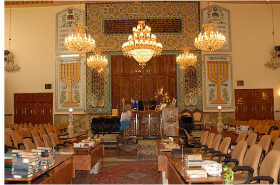
کنیسه یهودیان تهران در یوسف آباد

جنبش‌های سیاسی، اجتماعی و شرعی جامعه کلیمی در سه چرخه مرجع دینی کلیمیان، نماینده کلیمیان در مجلس شورای اسلامی و هیئت مدیره انجمن کلیمیان تهران متمرکز است. هرگونه اعلام موضع یا پیگیری مسائل حقوقی، سیاسی و اجتماعی جامعه کلیمی از طریق نهادهای مذکور صورت می‌گیرد.