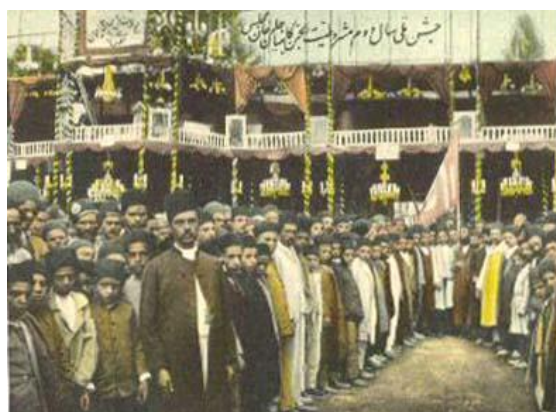
کلیمیان در جنبش مشروطه

دوران قاجار برای یهودیان دوران بازگشت دوباره رنج هاست. دوران از سرگیری تغییر اجباری دین (به ویژه فاجعه مشهد در زمان محمد شاه قاجار) است. [15]