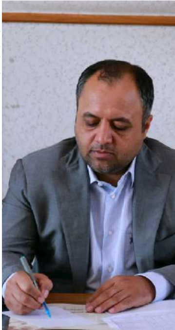
فکس: سازمان نوسازی مدارس

وی ادامه داد: تلاش‌های ارزشمند و متوعی که در این مدت از سوی مدیران، معلمان مدارس و خانواده‌های محترم در ارائه آموزش‌های غیرحضورى انجام شده است به صورت منظم‌تر و سازمان یافته‌تر استمرار می‌یابد.