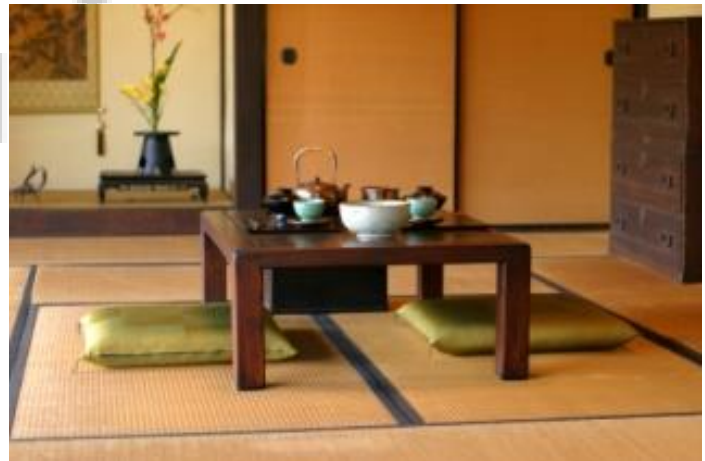
شکل 4. نمونه ای از میزهای صرف غذا

زندگی در خانه های ژاپنی به شکل وسیعی تحت تأثیر فرهنگ زیستی آنهاست. مبلمان خانه هاشامل یک میز کوچک، چندین قفسه برای انبارکردن و یک میز کوتاه کوچک برای نوشتن می باشد. خانواده ها هنوز مطابق سنت قدیمی ژاپن، برای خوردن و آشامیدن، در اطراف میزهای کوچک زانو می زنند. شکل شماره 4. نمونه ای از این میزها را نشان می دهد. ژاپنی ها از دیر باز روی زمین می خوابند. رختخوابها درون کمدهایی مخصوص نگهداری می شوند. در گذشته، در خانه هایی که تعداد بچه ها زیاد بود، بعضی از آنها در این کمدها می خوابیدند. در خانه های سنتی بطور معمول، درها و پنجره ها، صفحه ها دارای چارچوبی از جنس چوب هستند و جنس قسمت وسط بر اساس اینکه در کجای ساختمان استفاده شوند متغیر است. ابعاد درها و پنجره ها نیز بر مبنای ابعاد حصیرهای تاتامی مشخص میشود. بطور معمول ارتفاع آنها 6 فوت یعنی برابر با طول یک تاتامی می باشد. بعضی از خانه ها برای حفاظت در برابر شرایط جوی از پنجره های با دو کشوی موازی هم استفاده می کنند.