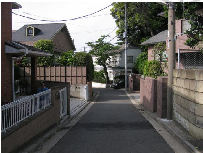
شکل 1. نمونه ای از یک محله ژاپنی

در ژاپن در خیابان‌های کوچک غالباً نوعی از معماری نیمه باز ، با درها و پنجره های هر چند پوشانده می یابیم که زندگی خانه فردی را با خیابان می گستراند تا جایی که با زندگی همسایه اش در هم می آمیزد . خانه ژاپنی چه محقرانه یا با شکوه ارتباطی فشرده با محیط اطرافش دارد و به عبارتی به خلاف معماری ایرانی برونگرا است و در هر جا که میسر باشد درداخل یک باغ حصار بندی شده با پرچین‌های خیزرانی که خود یک عنصر زیبایی آفرین است، قرار داده شده است .منظر بسیاری از خانه های ژاپنی یکسان می باشد و خانه هادارای سقف سفالی می‌باشند که باغچه ای در جلو یا پشت خانه وجود دارد . مجسمه های سنگی با سمبل‌های مذهبی در باغچه‌ها برای حفاظت خانه و صاحبخانه وجود دارد . شکل شماره یک نمونه ای از یک محله ژاپنی را نشان می‌دهد.