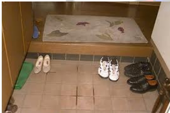
شکل 2. نمونه ای از یک کفش کن

در بیشتر خانه های ژاپن، قسمت ورودی بصورت یک دالان یا هشتی میباشد که اختلاف سطحی در حدود ده سانتیمتر از سطوح دیگر خانه دارد. از آنجایی که در فرهنگ ژاپنی مرزی بین فضای کثیف (خارج خانه که کفش پوشیده می شود) و فضای تمیز (داخل خانه که دمپایی مخصوص پوشیده می شود) وجود دارد، این محل پایین تر از جاهای دیگر خانه است که به کفش کن معروف است. در این محل کفشها را بیرون می آورند و در قفسه های جای کفش قرار می دهند و از این محل، دمپایی مخصوص درون خانه را می پوشند. شکل شماره 2. نمونه ای از یک کفش کن را نشان می دهد. در مواقعی که جشن خاصی مثل جشن سال نو باشد، علامتهای خاصی در ورودی نصب می شوند که نشان دهنده اجازه دخول است. این روش علامت گذاری مطابق یک روش مذهبی قدیمی است که در مکانهای مقدس نیز کاربرد داشته است. اختلاف سطح ورودی با سطح خانه و همچنین نصب علامت ها نه تنها در خانه های سنتی و ویلایی وجود دارد بلکه در اکثر خانه های جدید و آپارتمانها نیز به چشم می خورد.