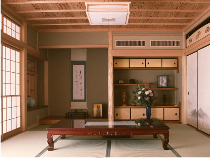
شکل 3. نمونه ای از یک اتاق