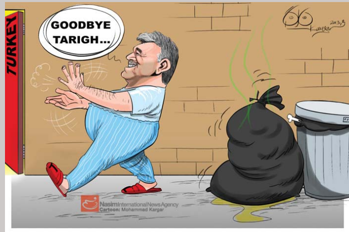
News International News Agency Cartoon: Mohammad Kangar