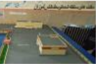
نقشه های ساخته شده در این رشته