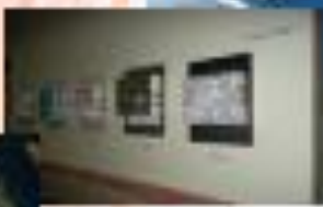
استفاده از نرم افزار در مساحت مساحت