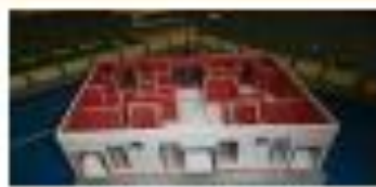
استفاده از نرم افزار در مساحت مساحت