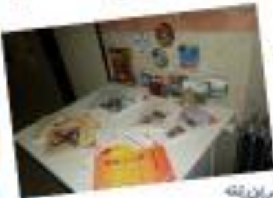
کلیه ابزارهای این رشته