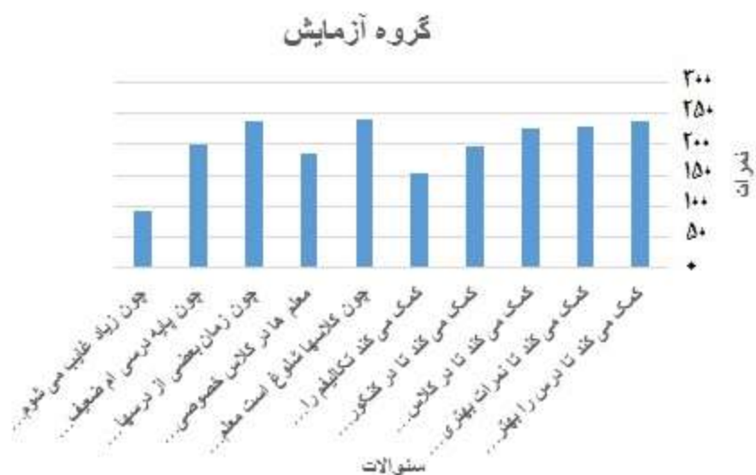
شکل شماره ۳. نتایج گروه آزمایش در پس آزمون