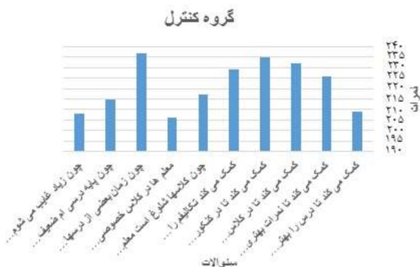
شکل شماره ۴. نتایج گروه کنترل در پس آزمون

با مقایسه دو گروه آزمایش و کنترل تفاوت معناداری در دیدگاه در مورد تدریس خصوصی در گروه آزمایش نسبت به گروه کنترل مشهود است