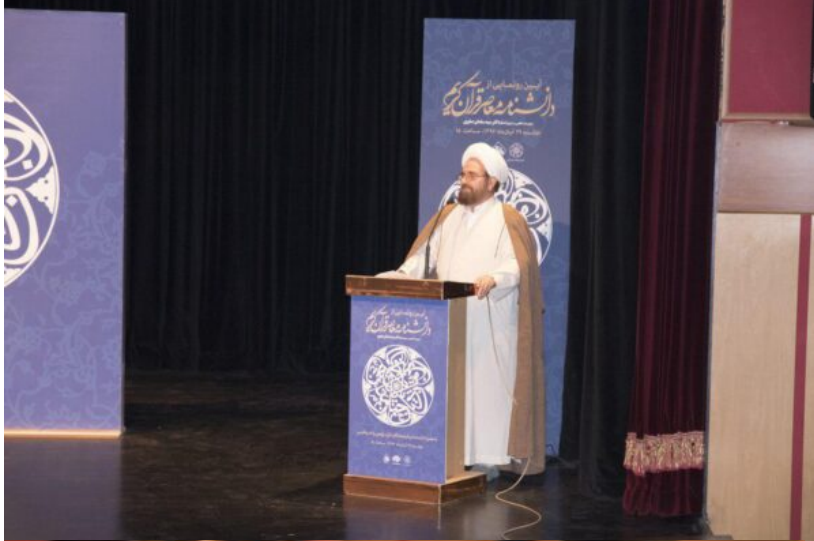
باشگاه خبرنگاران پویا