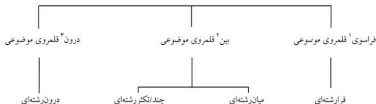
شکل ۱. ترکیب‌های متفاوت دیسیپلین‌ها (اداره آموزش و پرورش شهر منیتوبا ۲ کانادا، ۲۰۱۴)

پیوند و تعامل میان دانش، مفاهیم، روش‌ها، تجارب و ابزارهای مختلف از رشته‌های گوناگون درخصوص موضوع یا مسئله مورد نظر هستند که نوع همکاری، مشارکت و شیوه‌های مواجهه با موضوعات و مسائل پیچیده را به کنشگران نشان می‌دهند (خورسندی طاسکوه، ۱۳۸۸). شکل (۱) ترکیب‌های متفاوت رشته‌ها را بر اساس نوع تعامل، تبادل و همکاری رشته‌ها نشان می‌دهد. گونه‌های مختلف همکاری رشته‌ای را می‌توان بر پیوستاری قرار داد که در یک سوی آن گونه‌های ظریف و در سوی دیگر آن گونه‌های رادیکال قرار دارند. در سوی ظریف پیوستار، همکاری رشته‌ها به موضوع‌هایی از رشته‌های مختلف تلقی می‌شود که به نوعی به یک موضوع کلی مربوط می‌شوند. مثل مطالعات زنان، که به دور رشته یا بیشتر نیاز است. در ادامه این پیوستار، استحکام بخشی مرزهای رشته‌ای و جای نقد دیالکتیکی رادیکال دوطرفه حوزه‌های متضاد را باز می‌گذارد (دیویدسون ۱ ، ۲۰۰۴). این دیدگاه ممکن است در عین حفظ یکپارچگی شدید رشته‌ای، صرفاً نقد و تبادل انتقادی نظرات را به کار ببرد. با حرکت بیشتر در امتداد پیوستار، گونه دیگری از همکاری رشته‌ها رخ می‌نماید که بر این استوار است که برخلاف چندرشته‌ای که طرفداران آن نیاز نیست راجع به امور با یکدیگر به بحث پردازند، این گونه همکاری رشته‌ها نیازمند کم و بیش تلفیق بوده و حتی تا حدودی ملزم به اصلاح و تعدیل زیربخش‌های رشته‌ای هستند، مثل مسأله ایدز یا مسأله بحران آب. در سر دیگر پیوستار شکل (۱)، دیدگاه فروپاشی مرزهای رشته‌ای و ظهور یک رشته جدید وجود دارد. این نوع ترکیب را تحت عنوان فرارشته‌ای می‌شناسند (نیکولسکو، ۲۰۱۰).