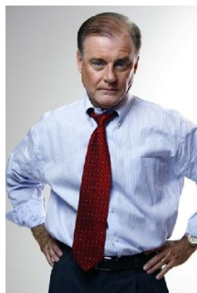
>> ژستی بیانگر اعتماد به نفس