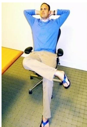
ژست راحت و باطمینان <<

حالی که شل و وارفته بودن، تأثیری منفی بر مخاطب دارد. در آگهی تبلیغاتی نشریه اسپورت/ایلاستریته، ۱ مردی که پشت پیش‌خوان ایستاده است، به سمت جلو خم می‌شود (به سمت دوربین) تا درباره پیشنهاد ویژه ثبت اشتراک نشریه، مطلبی را به ما بگوید. این حالت بدن، حس صمیمیت و رابطه‌ای غیر رسمی را به مخاطب القا می‌کند؛ حسی که دوستی، صداقت و اعتماد را ایجاد می‌کند. این شخص سعی ندارد «چیزی را بفروش برساند»، بلکه تنها می‌خواهد موضوع خوبی را با ما در میان بگذارد. حالت بدن می‌تواند اندیشه فرد را نشان دهد، شخصیت او را آشکار کند یا بازتابی از نگرش‌های وی باشد. در زیر، نمونه‌هایی از این حالت‌ها ترسیم شده است.