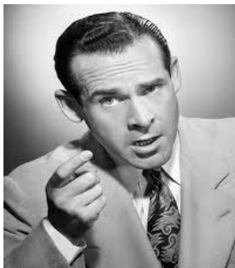
موضعی قاطع و جسورانه <<