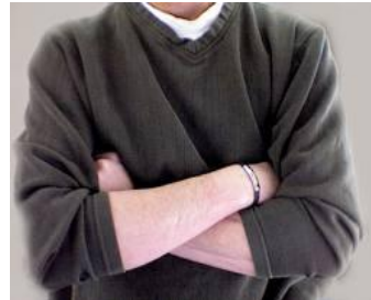
>> حالت تدافعی