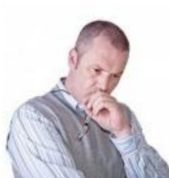
حالت متفکرانه <<