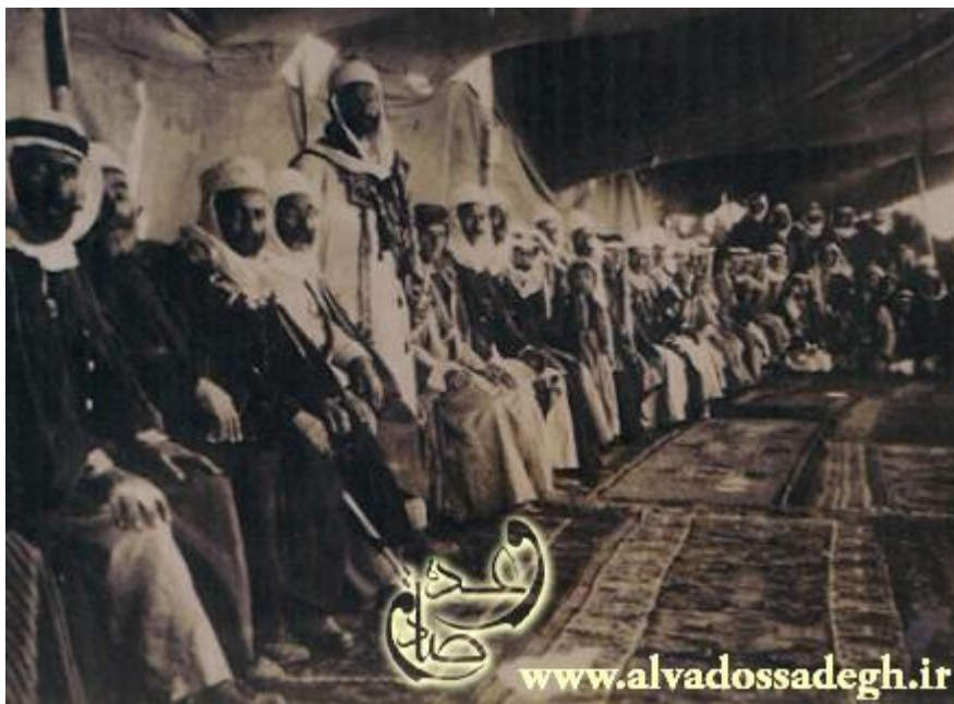
طوایف دروزی سوریه

در حال حاضر دروزی ها در سوریه جمعیتی معادل ۸۰۰۰۰۰ نفر دارند و نقش مهمی در معادلات سیاسی و نظامی کشور سوریه بازی می کنند. به نحوی که در زمان کنونی تعداد زیادی از افسرهای دروزی در ارتش بعثی سوریه، خدمت می کنند. بیشتر ساکنان « دروزی » سوریه در منطقه ی « جبل الدروز » و در بخش جنوب غربی سوریه زندگی می کنند.(۱۵)