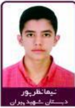
تیمنا نظریور دستان شهید پیران