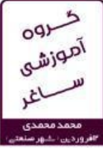
محمد محمدی شهروردین شهر صنعتی