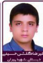
علیرضا گلشن دستان شهید پیران