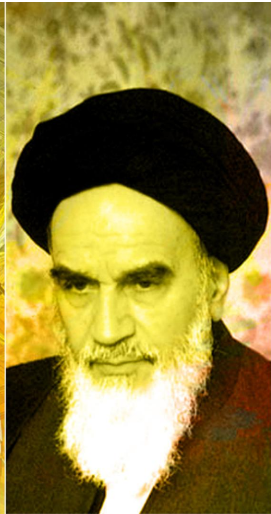
امام خمینی (ره) :

نباید شک داشت که انجمن های اسلامی دانش آموزان از جمله مجموعه های بسیار پر تلاش و پر کار و با ایمان محسوب می شوند، به شما به چشم عناصری بسیار عزیز نگاه می کنیم، قدر شمارا میدانیم و این امید را در دل می پرورانیم که انشاء الله در آینده این کشور، نقش و فعالیت شما بتواند آرزو های بزرگ این ملت را بر آورده کند.