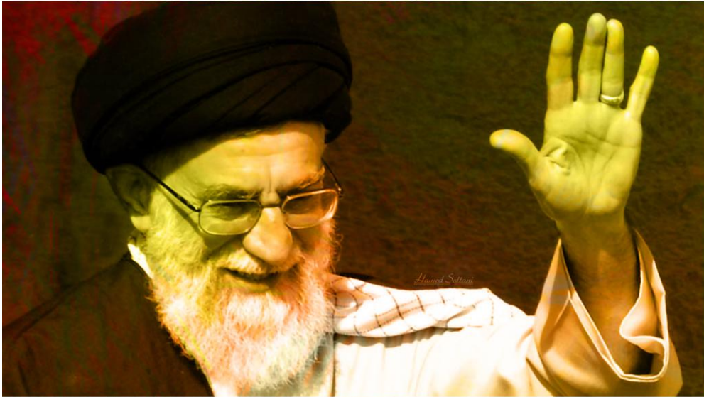
مقام معظم رهبری

نباید شک داشت که انجمن های اسلامی دانش آموزان از جمله مجموعه های بسیار پر تلاش و پر کار و با ایمان محسوب می شوند، به شما به چشم عناصری بسیار عزیز نگاه می کنیم، قدر شمارا میدانیم و این امید را در دل می پرورانیم که انشاء الله در آینده این کشور، نقش و فعالیت شما بتواند آرزو های بزرگ این ملت را بر آورده کند.