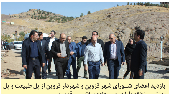
بازدید اعضای شورای شهر قزوین و شهردار قزوین از پل طبیعت و پل معلق - منطقه پاراجین - جاده سلامت - قزوین

مهم مطرح شده در صحن شورای شهر بود. علاوه بر موارد ذکر شده، پیگیری مستمر جهت اختصاص گرمخانه بانوان انجام شد که در نهایت منجر به راه اندازی اولین گرمخانه اختصاصی بانوان در شهر قزوین گردید.