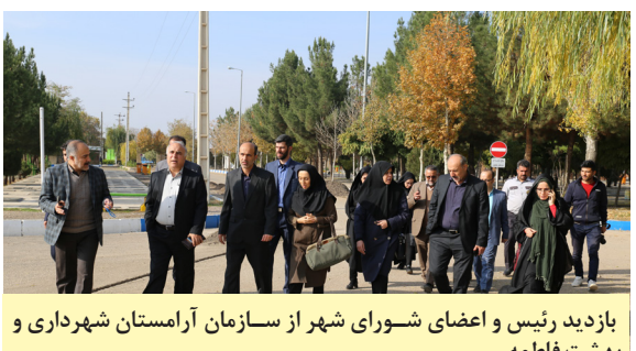
بازدید رئیس و اعضای شورای شهر از سازمان آرامستان شهرداری و بهشت فاطمه

سرپرست و بد سرپرست پیگیری های لازم را صورت داده است. رئیس شورای اسلامی شهر قزوین در دوره پنجم فعالیت در حوزه های اجتماعی و فرهنگی را از وظایف مهمی دانست که قانون گذار بر عهده شهرداری و شورای شهر گذاشته است.