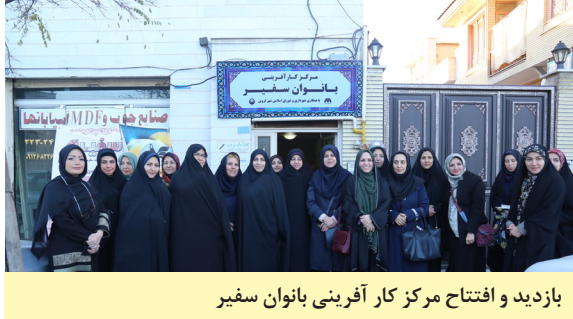
بازدید و افتتاح مرکز کار آفرینی بانوان سفیر

داودی افزود: نظارت بر عملکرد سازمان مدیریت پسماند و تأکید مستمر در خصوص موضوعات تفکیک زباله از مبدا و آموزش شهروندی نیز از موضوعات