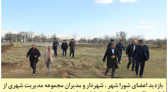
بازدید اعضای شورا شهر، شهردار و مدیران مجموعه مدیریت شهری از اراضی واقع در طرح اتصال پل امام رضا به پل ابوترابی

وی افزود: لایحه تفاهم نامه شهرداری با شرکت آب و فاضلاب شهری در خصوص اصلاح شبکه در بافت های فرسوده نیز در شورای شهر بررسی شد. وی در پایان بررسی تعریفه عوارض نوسازی و کسب و پیشه برای سال ۹۸ و تحقق ۶۰ درصدی درآمد پیش بینی شده در بودجه سال ۹۷ کل شهرداری از موارد مهم قابل ذکر در سال جاری در حوزه مالی و اقتصادی دانست.