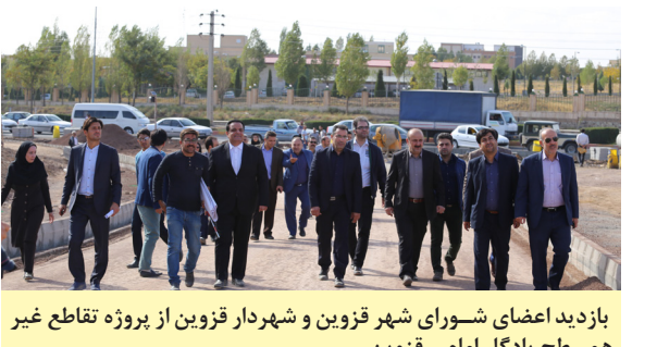
بازدید اعضای شورای شهر قزوین و شهردار قزوین از پروژه تقاطع غیر همسطح یادگار امام - قزوین