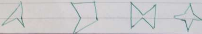
۲) کونک مقعر: