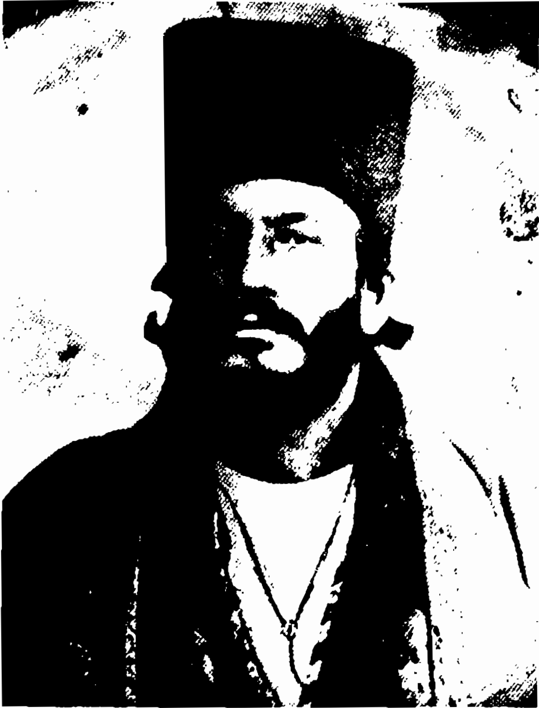
حسینقلی خان ایلخانی، در حدود سال ۱۸۷۹ میلادی