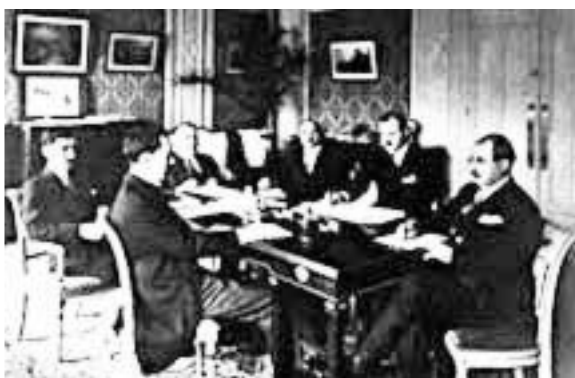
جمعی از دولتمردان آذربایجان