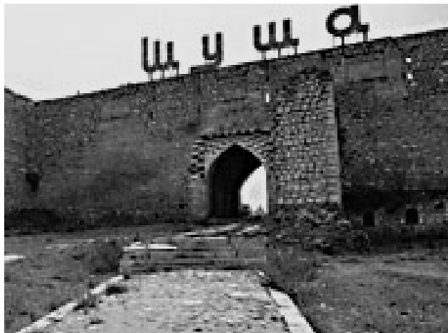
دروازه گنجه در شوشا