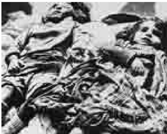
کشتار غیرنظامیان آذربایجانی توسط ارمنیان. خوجالی. فوریه ۱۹۹۲