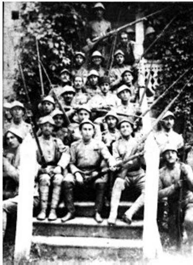
سربازان ارتش آذربایجان . ۱۹۱۸