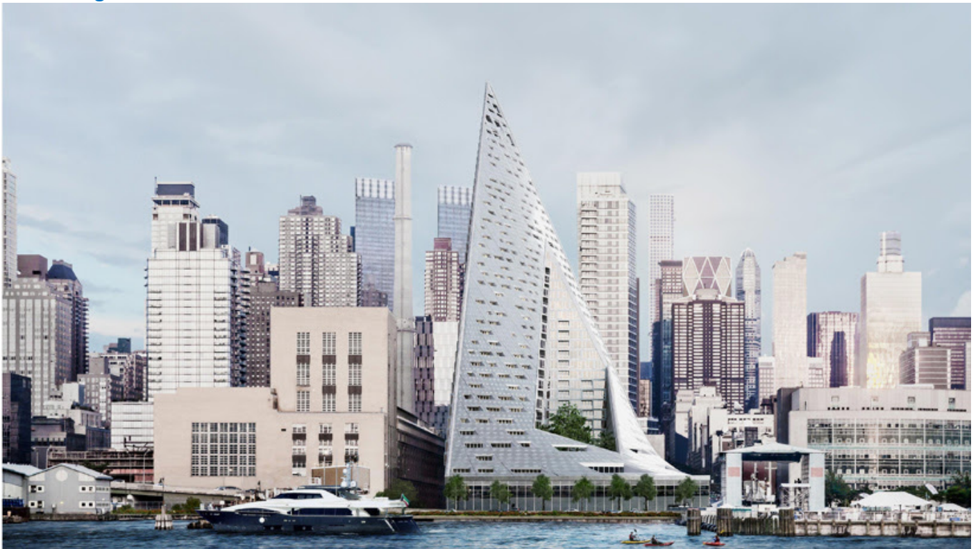
جا نمایی پروژه در سمت غربی بزرگراه منتهن و در امتداد و با منظر رودخانه هادستون