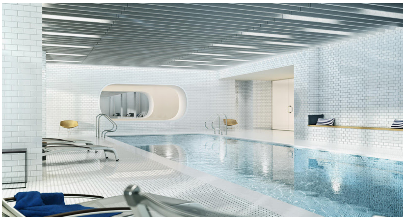
فضاهای مسکونی به استخر شنا دسترسی دارند .