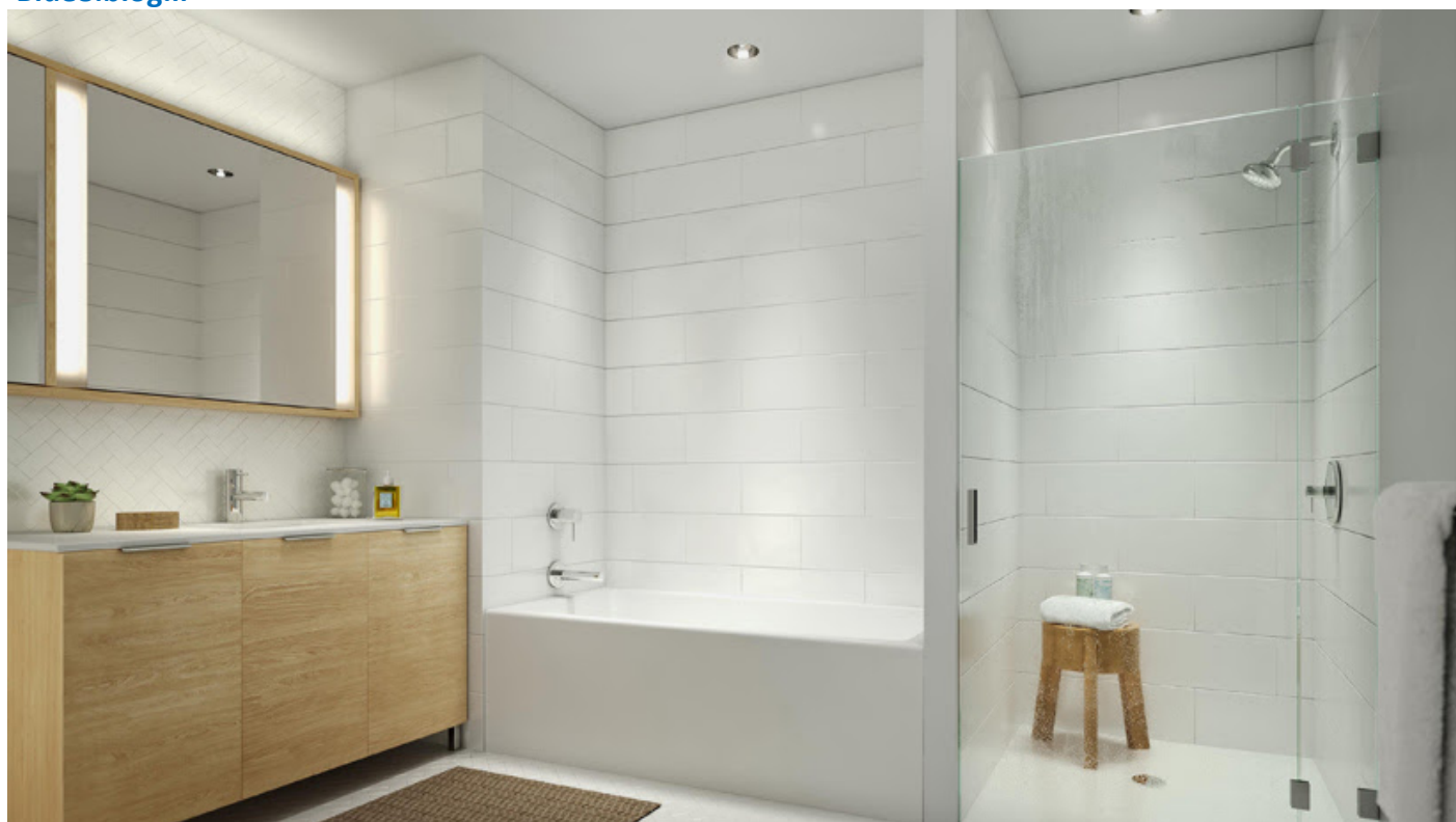
حمام ها به انواع شیرآلات و تجهیزات مجهز هستند .