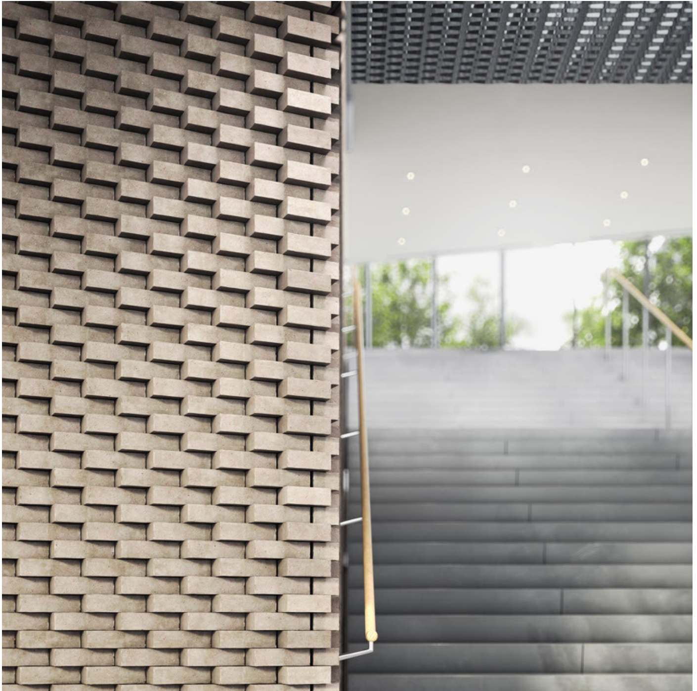
فرم جذاب آجرها در امتداد ورودی