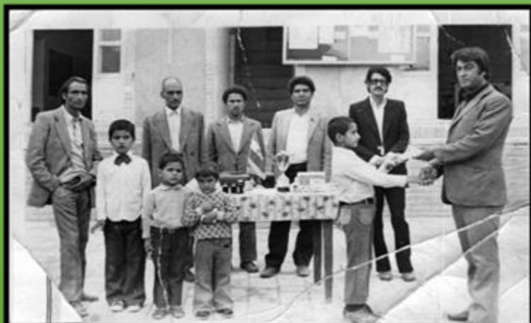
«دبیرستان کاظمی تفت - دهه ۵۰ خورشیدی»

به کمک والدین یا معلمین خود، نام و نام خانوادگی مدیر، ۲ نفر از آموزگاران و ۲ نفر از دانش آموزان عکس روبرو را، به نشانی پژوهشسرای دانش آموزشی تفت بفرستید. و بگویید چه پیام هایی از این تصویر به ذهنتان خطور می کند؟!